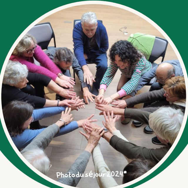
Photo du séjour 2024*