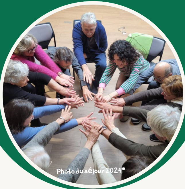
Photo du séjour 2024*